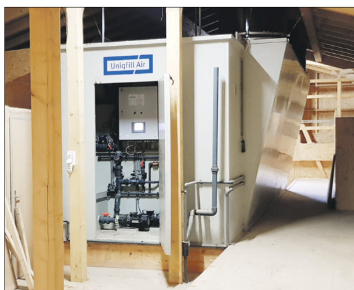
Die Luftwaschanlage im Obergeschoss ist auf die Sommerluftfrate ausgerichtet und bringt so genügend Leistung.