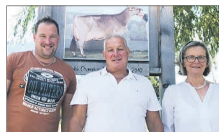
Gemischter Betrieb mit Milchvieh und Aufzucht