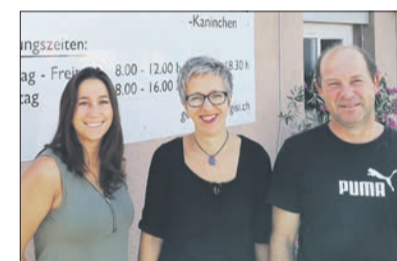
Betrieb mit Geflügelhaltung