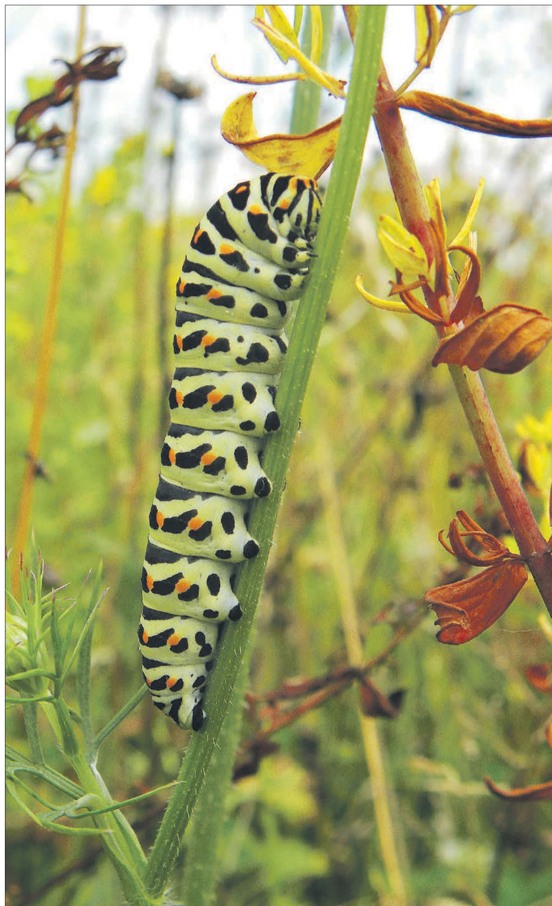
Eine Raupe des Schwalbenschwanz-Schmetterlings. Als Faustregel gilt: Eine Pflanzenart bietet Nahrungs- und Nistort für zirka zehn Tierarten, vor allem Insekten.

Ammoniak / Artenverarmung und zerstörte Lebensräume vieler Insekten und anderer Tiere sind nur einige der Folgen, wenn Ökosysteme überdüngt werden.