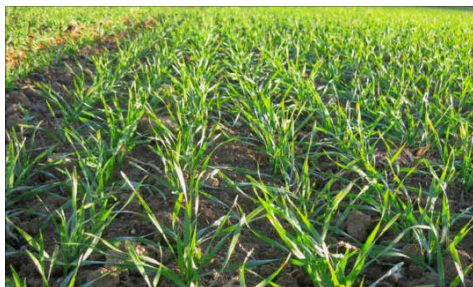
Swiss Granum rät, mehr Futterweizen auszusäen.

Beim Brotweizen wird eine Aufteilung der Produktion auf die Klassen von 40 Prozent Top, 40 Prozent Klasse I und 20 Prozent Klasse II angestrebt. • Suisse Premium/Suisse Garantie (Fenaco): Region Westschweiz: Anteil Top reduzieren, Klasse I beibehalten, Klasse II erhöhen. Region Mitte: Anteil Top erhöhen, Klasse I reduzieren, Klasse II beibehalten. Region Ostschweiz: Anteil Top erhöhen, Klasse I und II reduzieren. • IP-Suisse: Top Q erhöhen, Top beibehalten resp. reduzieren, Klasse I und II erhöhen.