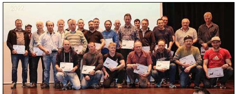
32 Züchter aus dem Kanton Luzern von 100000er-Kühen an der DV Swissherdbook Luzern.

350 Tiere wurden an der Viehschau aufgeführt. Miss OB wurde Harlei Helma, Miss SB Blooming Birke.