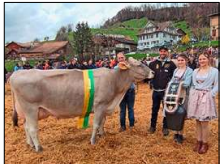
Den Titel Miss Braunvieh Steinerberg holte sich Blooming Birke.