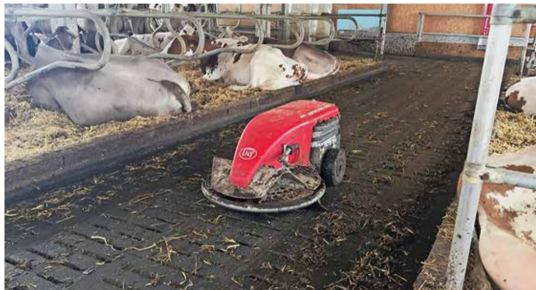
A l'heure actuelle, aucune étude scientifique ne prouve l'efficacité des robots de nettoyage pour réduire les émissions d'ammoniac dans les étables à bovins.

Des aires de circulation propres et sèches protègent les onglons, améliorent la propreté des logettes et émettent généralement moins d'ammoniac que les surfaces humides et sales. Mais il serait faux de conclure que les robots de nettoyage induisent automatiquement une réduction des émissions d'ammoniac. Dans la recherche de mesures rapidement applicables pour réduire les émissions d'ammoniac dans la production bovine, les robots de nettoyage pour les aires de circulation sont parfois mis en avant.