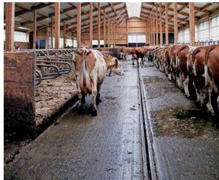
La récupération de l'urine grâce à une pente transversale de 3% et une rigole centrale réduisent les émissions.

Des études hollandaises montrent que des aires de circulation non perforées, souvent nettoyées et propres, avec une pente transversale, une rigole de récupération de l'urine et une évacuation du fumier vers un espace couvert émettent moins d'ammoniac que les caillebotis au-dessus d'une fosse à purin.