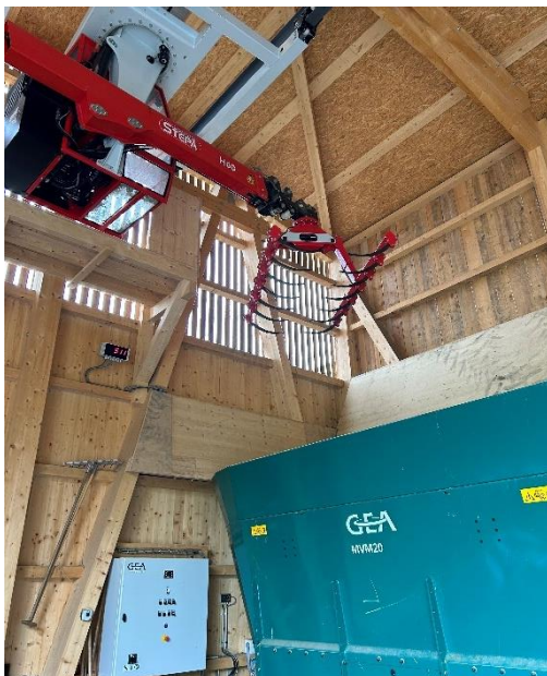
Der stationäre Futtermischwagen kann maschinell mit dem Kran beladen werden.

Die gewünschte Arbeitsentlastung wurde durch den Neubau erreicht. Ich spare täglich zwei bis drei Stunden Arbeit. Dies, obwohl etwas mehr Kühe im Stall stehen, die tendenziell öfter gemolken werden. Zudem wird durch die Automatisierung die körperliche Belastung minimiert. Beispielsweise kann der stationäre Futtermischwagen maschinell mit dem Traktor oder dem neuen Kran gefüllt werden und das Futter wird automatisch mit dem Futterband verteilt. So fällt das manuelle Zustossen des Futters weg und der Traktor ist nicht ständig belegt.