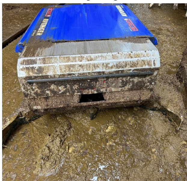
Der Entmistungsroboter reinigt die Laufflächen alle zwei Stunden.

Der Roboter ist auf zwei Routen programmiert, für welche er jeweils inklusiv Laden der Batterie eine Stunde benötigt. Das heisst, dass die gesamte Lauffläche alle zwei Stunden gereinigt ist. Einzig wenn die Kühe auf der Weide sind, pausiert der Roboter.