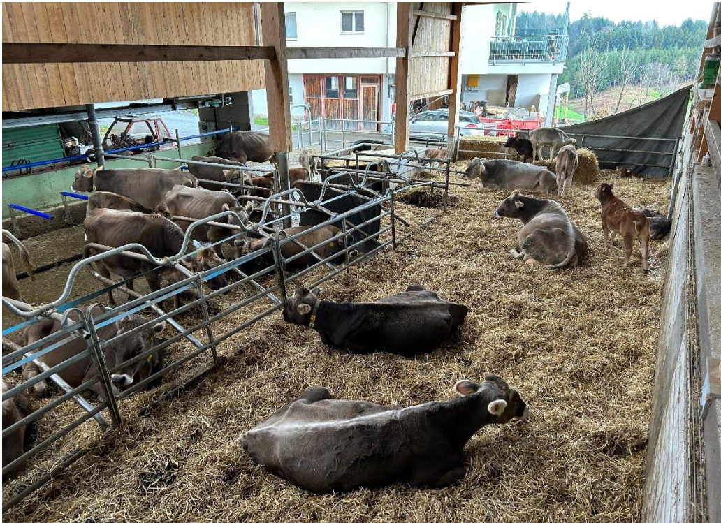
Der Bereich der Ammenkühe und Kälber ist mit Stroh ausgestattet.

etwas zu kurz kommen, geben. Dieser Kontakt mit den Kälbern und Kühen ist wichtig, da ich so auch immer zwei Mal täglich kontrollieren kann, ob alles in Ordnung ist.